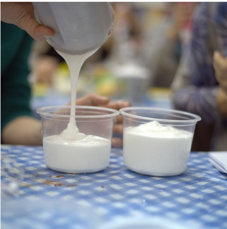
pianka do golenia