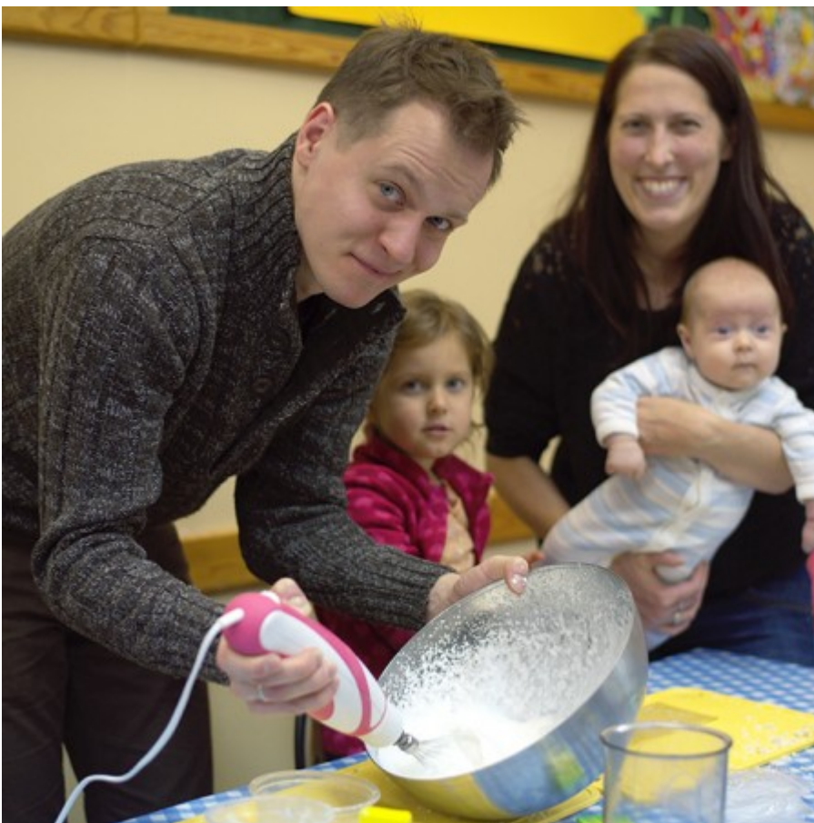
rodzina w akcji