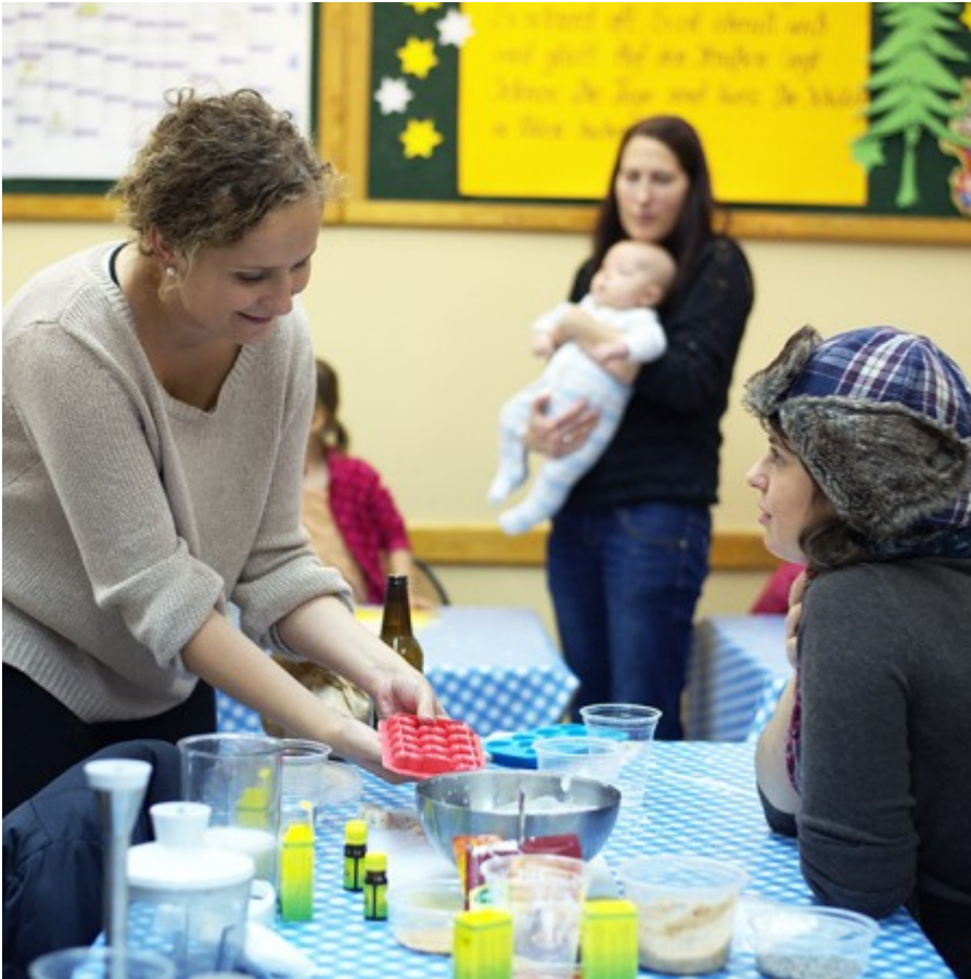
czasem trzeba pomóc