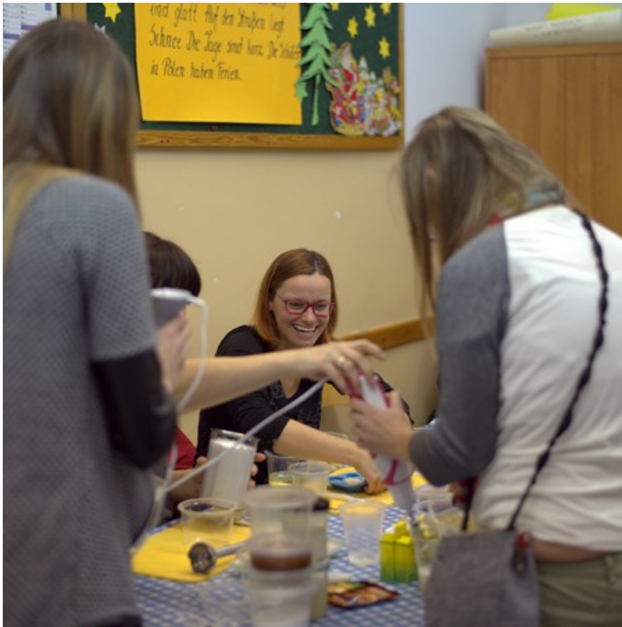
coś poszło nie tak – pianka