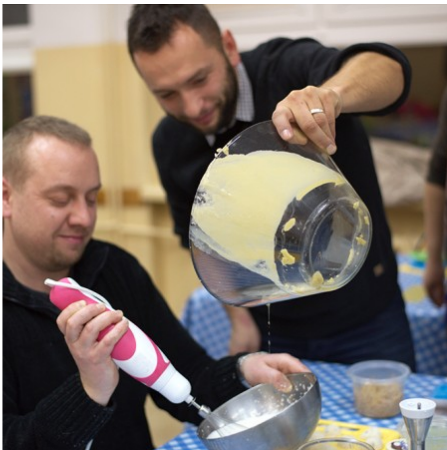
panowie też pomagają