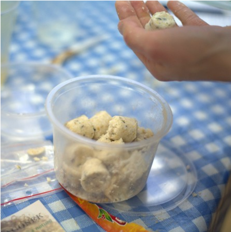
bomby do kapieli