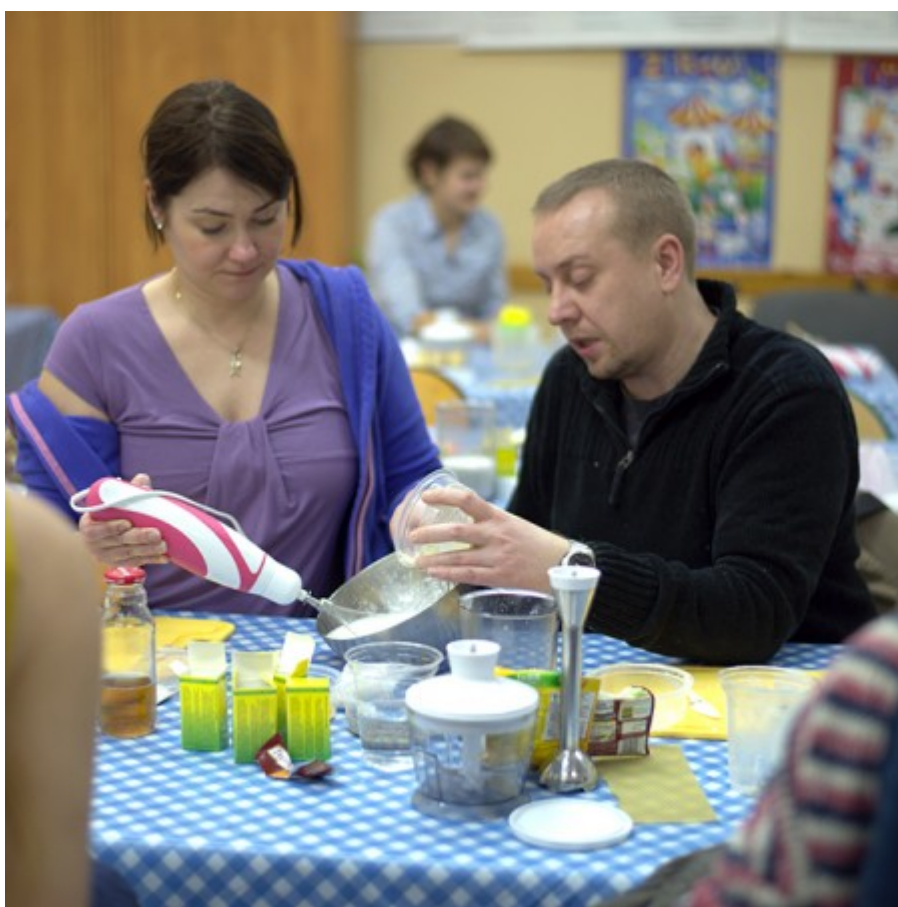
współpraca to podstawa